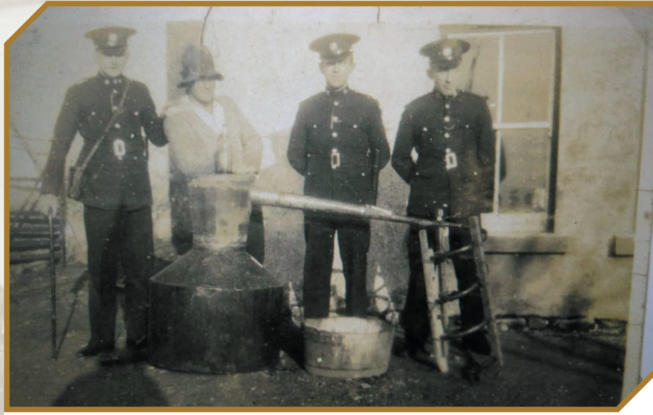
Captured poitin still, Indreabhán Garda station c. 1930s. Stíl phoitín a gabhadh, stáisiún Gardai Indreabháin thart ar na 1930idí.

Lean comhaltaí i gcuid de na stáisiúin dá gcuid socruithe féin a dhéanamh chun a gcumas teanga féin a fheabhsú. I Stáisiún áirithe chuir an Sáirsint ceachtanna ar fáil, fostaíodh múinteoirí i stáisiúin eile, múinteoirí ar íoc siad féin astu. Rinne cuid acu staidéar ar an teanga astu féin agus chuaigh cuid acu isteach sa chraobh áitiúil de Chonradh na Gaeilge. Bheadh inniúlacht sa Ghaeilge riachtanach i gcomhair ardú céime tráth níos déanaí.