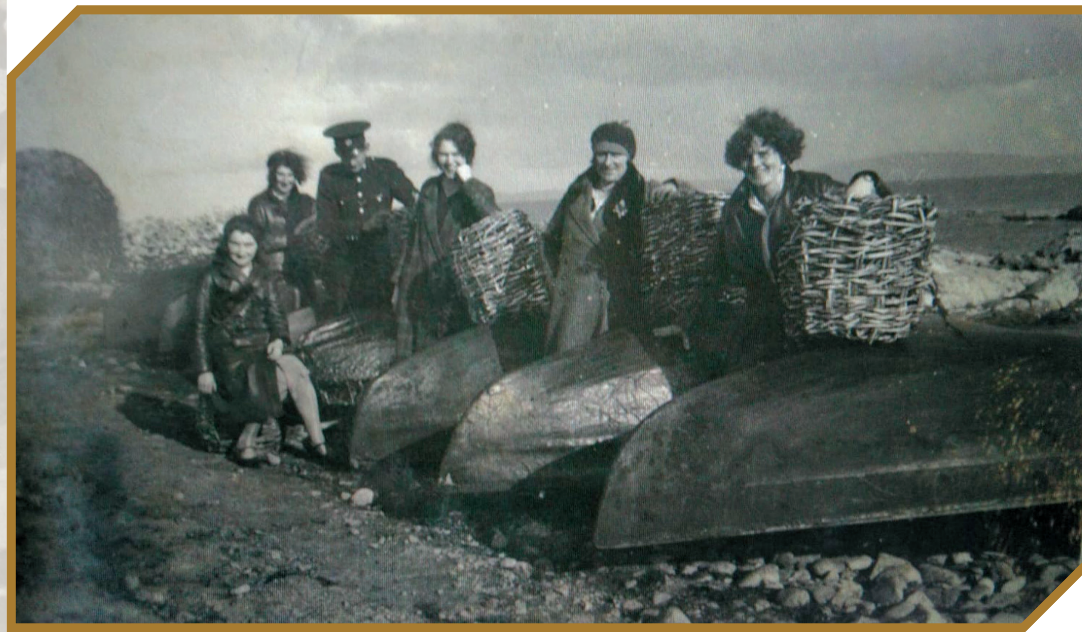
South Conemara c. 1920s/1930s. Conamara Theas sna 1920idí/1930idí.

D'ainneoin na n-iarrachtaí a bhí i gceist, bhí an-mhoill leis an dul chun cinn, a raibh roinnt cúiseanna leis. Ar cheann de na cúiseanna bhí an faitíos go gcuirfí chuig stáisiún Ghaeltachta a bhí scoite amach iad. Is mar seo a leanas a chuir comhalta amháin síos ag an am ar a stáisiún féin agus é ag scríobh chuig Athbhreithniú an Gharda Síochána, "the áras (station) is 4 miles from the nearest church, 8 miles from the nearest railway station, 20 miles from the nearest Doctor, 19 miles from the nearest District Court, 33 miles from the nearest District HQ and 36 miles from the nearest Divisional HQ. 99% of the people speak no English at all and there is no field for hurling or football."